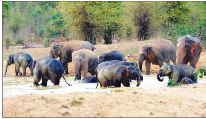
हरिभूमि न्यूज ▶▶ अम्बिकापुर

26 हाथियों का बड़ा दल जरापुर में एक महीने तक भ्रमण करने के बाद वापस लुण्डा जंगल में लौटा आया है। हाथियों के आबादी क्षेत्र के निकट भ्रमण करने के कारण ग्रामीण रतजगा करने मजबूर लम्बे समय तक प्रतापपुर, राजपुर एवं लुण्डा जंगल का भ्रमण करने के बाद 25 हाथियों का दल जरापुर की ओर गया था। जरापुर जंगल के भ्रमण के दौरान दल एक नया मेहमान शामिल हुआ है जिससे हाथियों की संख्या बढ़कर 26 हो गई है।